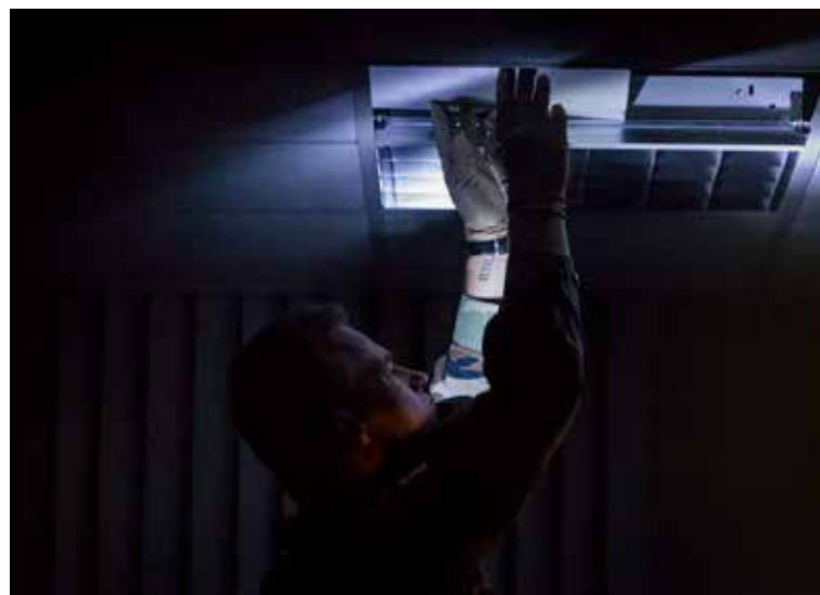
Holle ruimtes checken

"De meest uiteenlopende steunverzoeken komen bij ons binnen, dus niet alleen zandzakken vullen en varkenspest indammen. Geregeld krijgen we een aanvraag via Veiligheid & Justitie in het kader van een strafrechtelijk onderzoek. Wanneer bijvoorbeeld het vermoeden bestaat dat een moordwapen ergens in het water is gegooid. Dan komen we op het werkgebied van de Defensie Duikgroep (DDG). Maar net zo goed kan er behoefte zijn aan search-capaciteit, om gebouwen op holle ruimtes te checken die contrabande of crimineel geld herbergen. Ook in de vrije natuur kunnen militairen onderzoek doen, zoals sporen nalopen. Vaak zijn dat trackers van het Korps Mariniers."