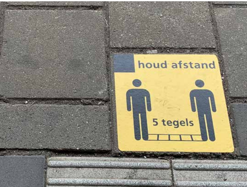
Coronamaatregelen in het straatbeeld

uitrol van deze steeds naar de nieuwe omstandigheden gewijzigde elkaar opvolgende noodverordeningen in de 25 veiligheidsregio's.