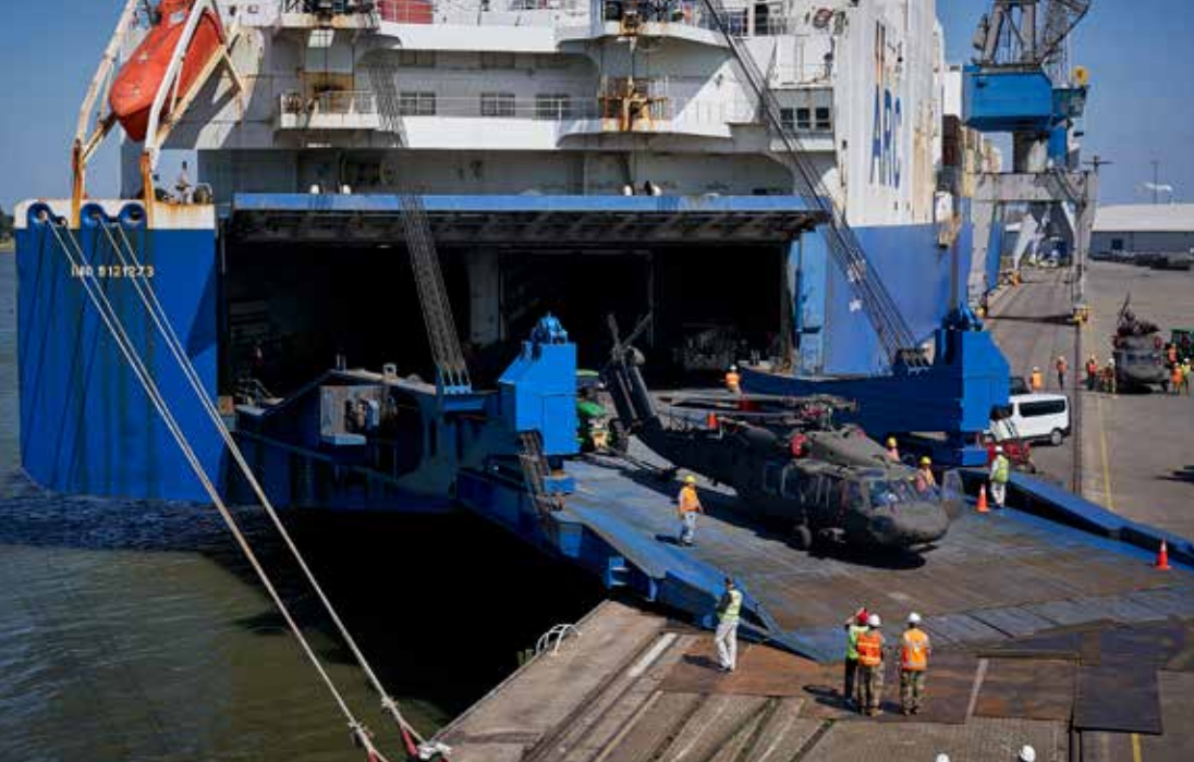
Havenbeveiliging bij troepenverplaatsingen.