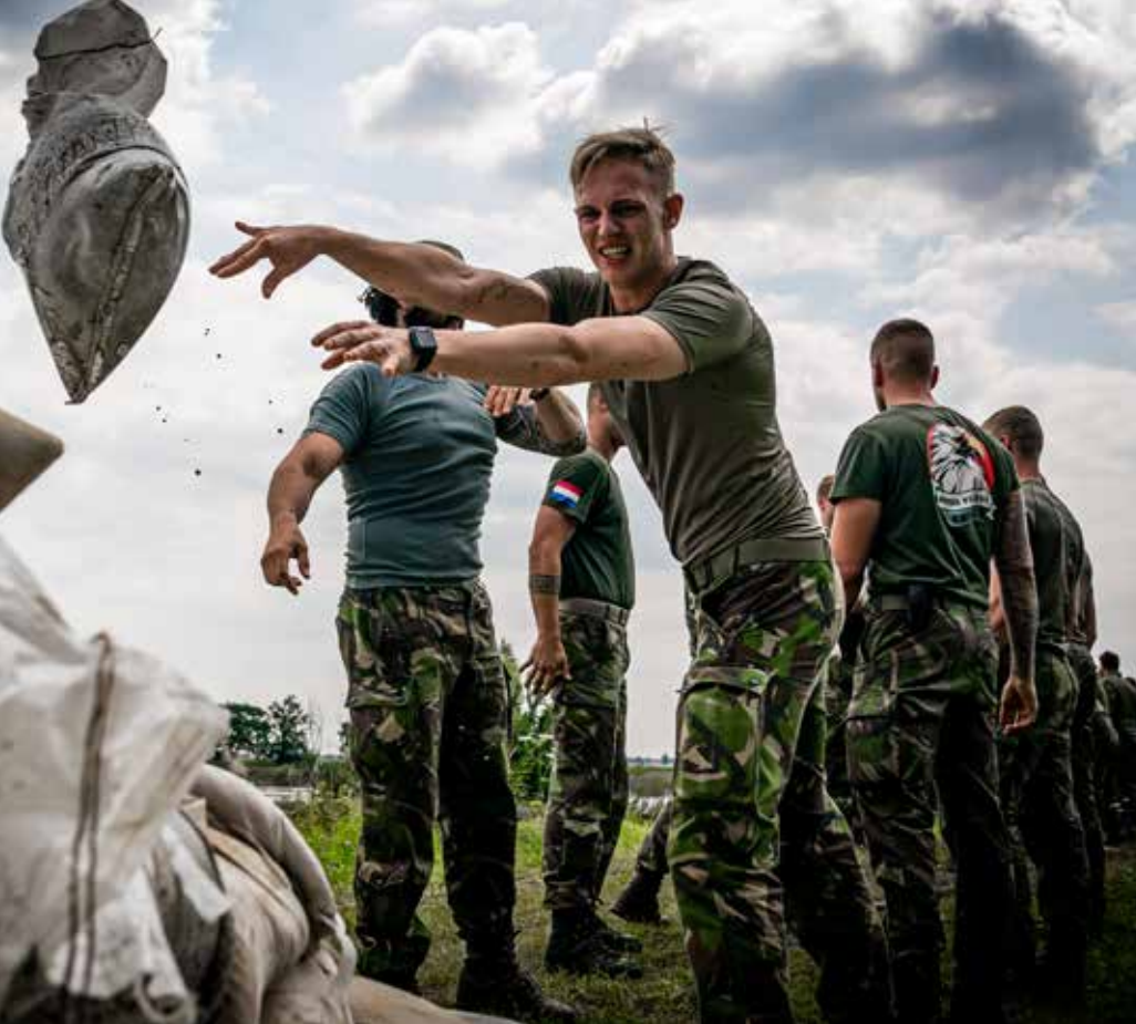
Defensie helpt met versterking dijken

regionaal, landelijk en internationaal niveau. Informatiemanagement, coördinatie van bijstand en steunverlening en ondersteuning van crisispartners zijn belangrijke taken van het LOCC. Hiernaast is het LOCC een informatie- en kennismakelaar voor operationele partners en dragen we bij aan bovenregionale en landelijke planvorming en advisering. Ook het zorgdragen voor de coördinatie, opleiding en inzet van Nederlandse experts in internationaal verband is een taak die het LOCC uitvoert. Daarnaast heeft zij zelf een tweetal specifieke operaties: repatriëring, en coördinatie inkomende buitenlandse hulp in Nederland (Host Nation Support-civil). Het LOCC vormt met haar werkzaamheden een brug tussen landelijke en regionale crisispartners en tussen diverse hulpverleningsdiensten.