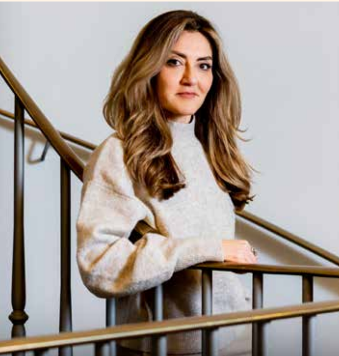
Dilan Yeşilgöz-Zegerius, minister van Justitie en Veiligheid