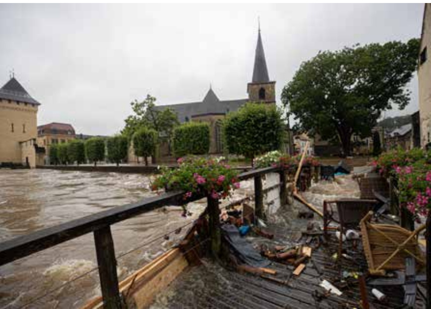
Overstromingen in Valkenburg

De overstromingen die Limburg troffen in juli 2021 waren extreem en uitzonderlijk te noemen. Het waren 3 crises die bij elkaar kwamen en resulteerden in de dramatische gebeurtenissen die bij velen nog op het netvlies gebrand zijn. Midden in de zomer, buiten het hoogwaterseizoen, regende het extreem hard en lang in Zuid-Limburg, waardoor alle buffers (opvangbekkens) overstromden (crisis 1). Een ongekende situatie waarbij onze beken en zijrivieren enorme hoeveelheden water kregen te verwerken. Dit zorgde ervoor dat ze buiten hun oevers traden (crisis 2). Om een voorbeeld te noemen van deze extreme hoeveelheden; normaal gesproken stroomt er 2 kuub water per seconde door de Geul, nu ging het om 107 kuub per seconde. Hierdoor kwam het water in de Roer en de Maas zo hoog te staan (crisis 3), dat zelfs de meters het niet meer konden meten.