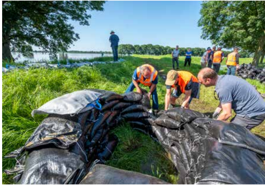
Medewerkers in actie met zandzakken

Water en ruimte kunnen niet los van elkaar gezien worden en zijn bepalend voor de waterveiligheid van de inwoners van Nederland. We moeten niet tegen het water vechten, maar met het water mee bewegen.