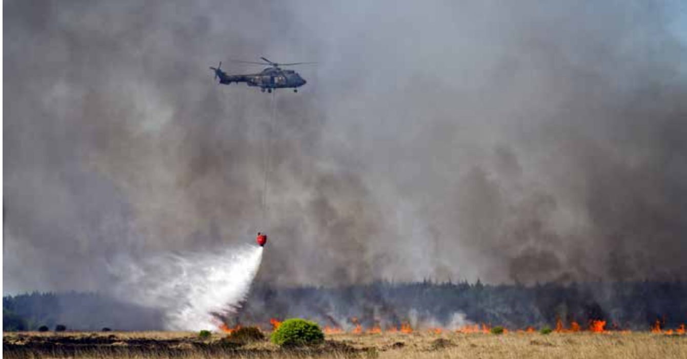
Defensie helpt met blussen natuurbrand

in alle hectiek aan bepaalde zaken niet toe en komt er een hulpvraag. Bijvoorbeeld het denken in scenario's en komen met adviezen, wat gebeurt er in de omgeving aan evenementen, wat is een goed stappenplan voor over een aantal dagen, waar is specialistische kennis of besluitvorming in een ministerie te vinden, wie moeten we daarvoor hebben, welke formele besluitvorming is nodig, wat zegt het landelijk crisisplan hierover, wat staat er in de bestuurlijke netwerkkaarten en hoe bereiken we die partijen, etc. Gerichtte samenwerking en in zekere zin "meedenken en ontzorgen" van de regionale collega's dus.