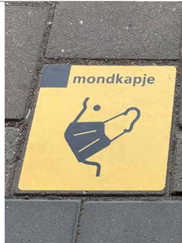
Tabel 2 - Epidemieën sinds 1900

De praktijk leert dat crises steeds grillig, onvoorspelbaar en altijd weer anders verlopen. In detail uitgewerkte vooraf bedachte bevoegdheden schieten daardoor bijna altijd tekort. Zo ook in deze pandemie. De Wet publieke gezondheid (Wpg) voorziet in specifieke noodrechtelijke bepalingen voor het bestrijden van een infectieziektecrisis, zoals geïsoleerde ziekenhuisopname met gedwongen medisch onderzoek voor besmette personen en (thuis) quarantaine voor personen die door contact met een lijder mogelijk besmet zijn. 6 Die bevoegdheden bleken na de uitbraak van het coronavirus echter al snel volstrekt ontoereikend om deze crisis te bezweren.